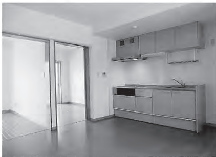
ダイニング・キッチン