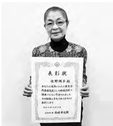
受賞おめでとうございます

また、町会長、保健所管内副会長、県理事の役職を歴任し、町の会費と県・保健所との橋渡し役となり、リーダーとして熱意をもって取り組んだことが評価されての受賞となりました。 おめでとうございます。