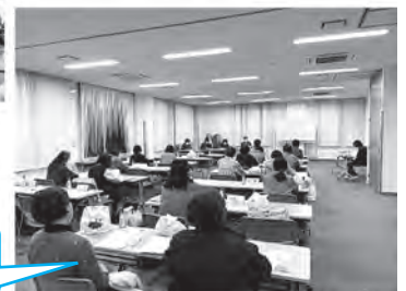
第3回分班長会議の様子