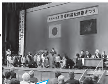
虫歯のない3歳児の表彰