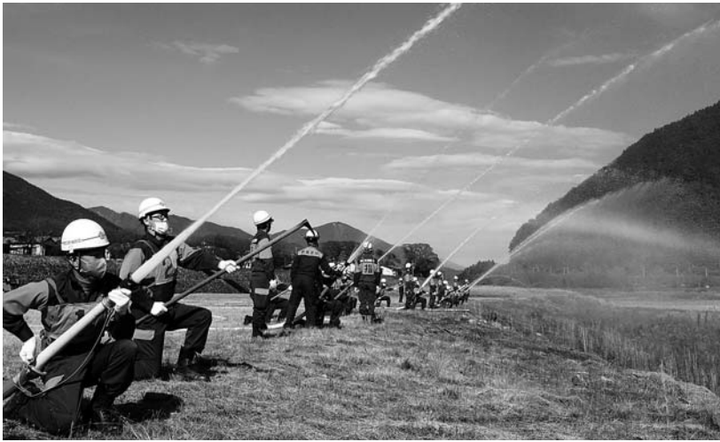
一斉放水披露に向けた訓練

出初式は、来年1月9日(日)、南部町文化ホールでの式典と南部の火祭りメイン会場での一斉放水披露の2部制となります。