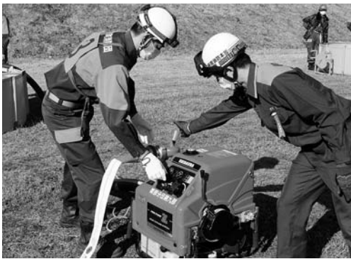
南分署署員による操作方法の指導

式典は、来賓や消防団員の人数制限して行いますが、第2部の一斉放水披露は、多くの皆さまに観覧していただきたいと考えております。