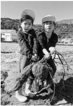
力を合わせてゲット!