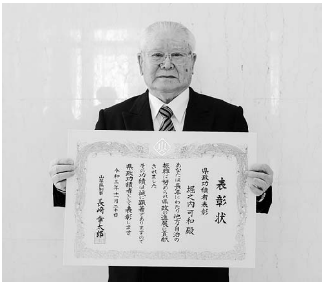
受賞おめでとうございます!

また、山梨県町村議会連合会会長として、県内町村による広域行政の円滑な運営に尽力するなど、地方自治の発展に尽くした功績が高く評価されての受賞となりました。