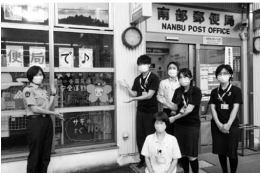
○南部警察署管内におけるアポ電件数(9月末) 月計 2件 年計 31件 (+13件)

南部警察署では、8月に引き続き、南部郵便局と連携し、郵便局の窓ガラスに「電話詐欺被害防止ペイント」を施す取り組みを行っています。この取り組みは、電話詐欺の被害防止のために、注意喚起に繋がるメッセージをペイントしました。南部警察署では、各関係機関のご協力のもと、今後も電話詐欺被害防止のため、広報啓発活動を推進していきます。