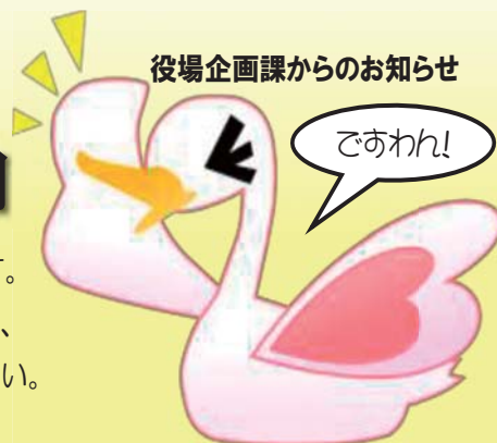
南部町婚活イメージキャラクター「シトリスさん」