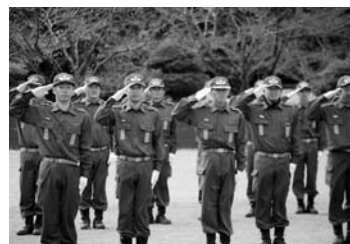
各種訓練を行い、午後は防火パレードを実施しました