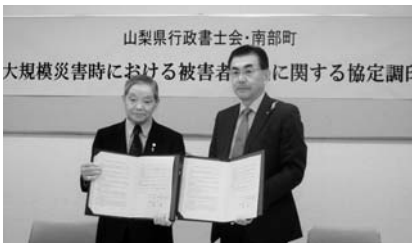
行政書士会との協定

このたびの、中央化学株式会社様、NPO法人コメリ災害対策センター様、南部町内郵便局様、山梨県行政書士会様のご理解ご支援による協定締結には、深く感謝を申し上げます。今後ともよろしくお願い申し上げます。