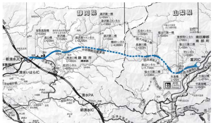
中部横断自動車道 新清水JCT～富沢IC間