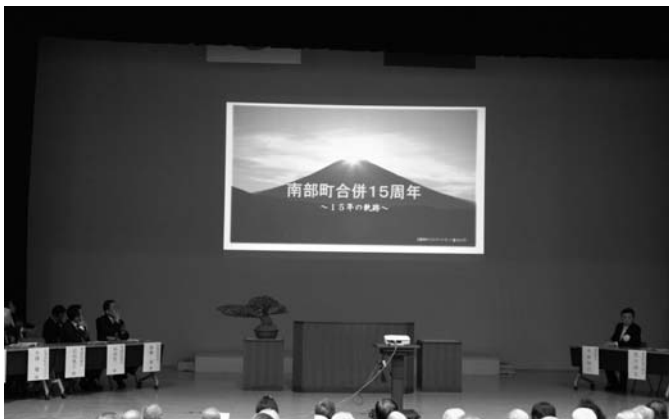
15年の経過報告をしました