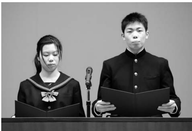
南部中学校の生徒による町民憲章朗読

式典では、国歌、南部町歌の斉唱、町長式辞や議会議長のあいさつ、町と同じく15歳を迎えた南部中学校3年生の生徒2人が「町民憲章」を朗読、これまでのあゆみをスライドで上映し、合併後町の発展に貢献された、175の個人や団体に感謝状が贈呈されました。