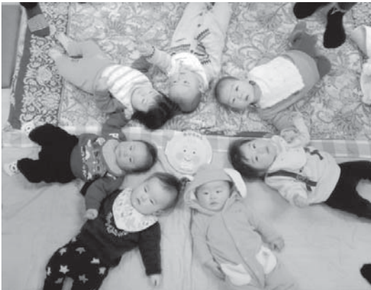
(すくすく教室・中期の赤ちゃん)

福祉保健課と図書館が推進し平成15年からスタートしたブックスタート運動。最初に本を手にしたお子様は、今年高校生になりました。肌のぬくもりを感じながらことばと心を通わす、そのかけがえのないひとときを応援する運動となったこの試みは若い保護者の方が図書館を利用するきっかけにもつながり多くの方が、毎週開催している乳幼児お話会に参加しています。今年度手渡した本「あかちゃん」(ブロンズ社)は月例にあった内容の優しさがとても好評でした。ブックスタートの様子と平成30年度の本紹介をいたします。