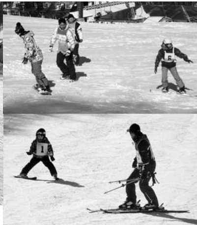
スキー・スノーボード教室を行いました