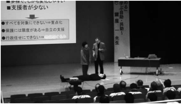
防災講演会の様子