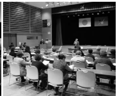
南部・富沢両地区文化協会解散に伴う総会