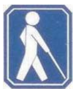
盲人のための 国際シンボルマーク