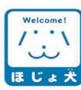
ほじょ犬マーク 盲導犬・介助犬・ 聴導犬の同伴を 啓発するマーク