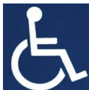
障害者のための 国際シンボルマーク