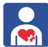
ハートプラスマーク 心臓等の身体 内部に障害のある 人を表すマーク