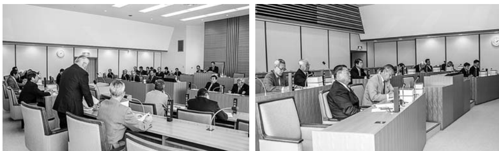
11月1日の臨時議会の様子