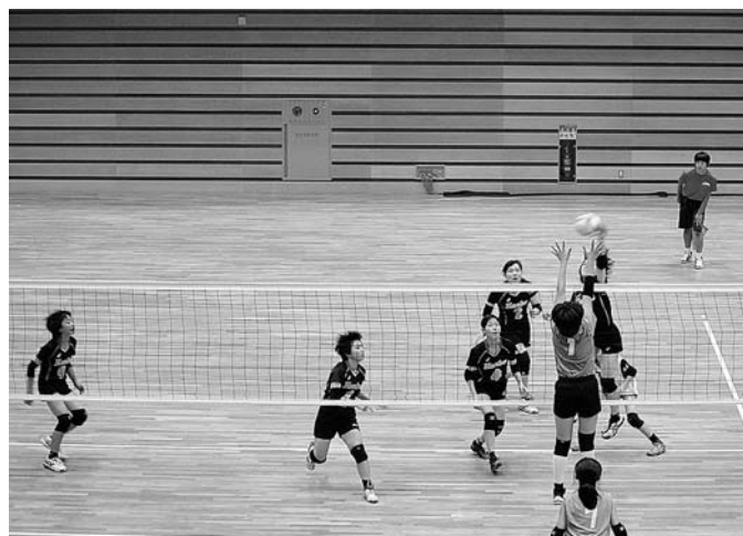
南部中女子バレー