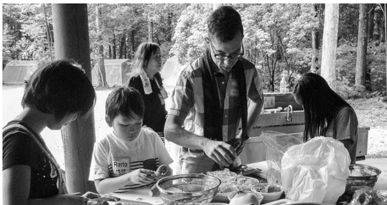
カレーを作りました

当日は、小学校5・6年生23名が参加し、オリエンテーリングやファンキータランなどのゲーム、カレー作りを英語で体験しました。