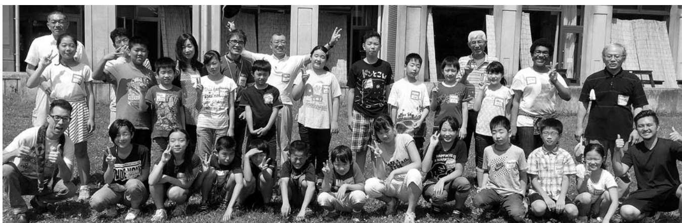
楽しく英語を学びました