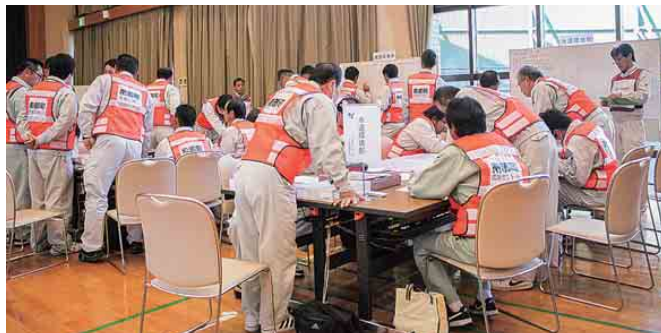
情報収集・分析・判断(訓練部)