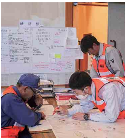
消防団幹部との協議(消防班)

町では今後も、職員・住民を対象に訓練等を実施していきたいと思っています。今後とも皆様のご協力をお願いいたします。