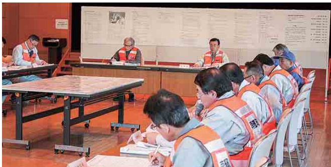
災害対策本部会議(本部長からの指示)