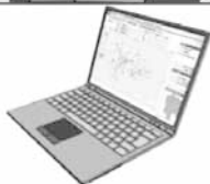
山梨県土砂災害警戒情報システム 検索