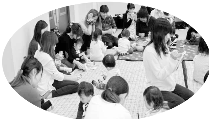
・おかあさんと工作! お面を作りました!

図書館ボランティア【たけの子会】がこれまでの活動内容が評価され、全国表彰となりました。おめでとうございます。 * 詳しい内容は、1月の広報でお知らせ致します。