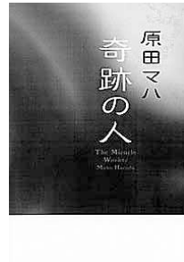
「奇跡の人」 原田マハ 著