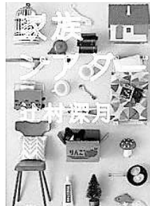
「家族シアター」 辻村深月 著