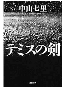
「テミスの剣」 中山七里 著