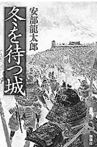
「冬を待つ城」 安部龍太郎 著