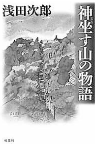
「神坐す山の物語」 浅田次郎 著