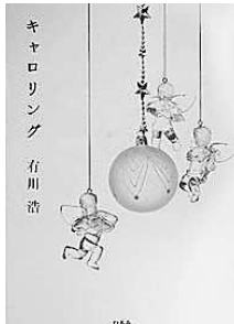
「キャロリング」 有川 浩 著