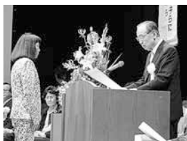
山梨県知事より表彰を受けました