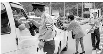
安全運転を呼びかけました