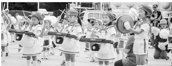
睦合・栄保育所園児による交通安全パレード