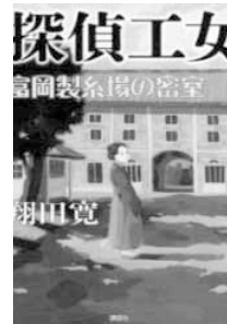
「探偵工女」 翔田 寛 著 明治新政府が総力を挙げて 建設した富岡製糸場を舞台と するミステリー小説。