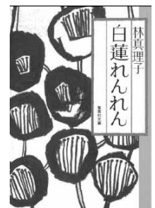
「白蓮れんれん」 林真理子 著 歌人柳原白蓮の生涯を小説 化。