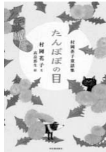
村岡花子童話集 「たんぽぽの目」 村岡花子 著 NHK [花子とアン]に登場 「みみずの女王」他26編