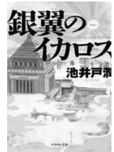
「銀翼のイカロス」 池井戸 潤 著 半沢直樹シリーズ第4弾。