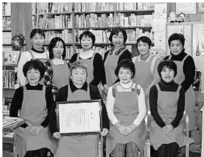
【たけの子会の皆様】