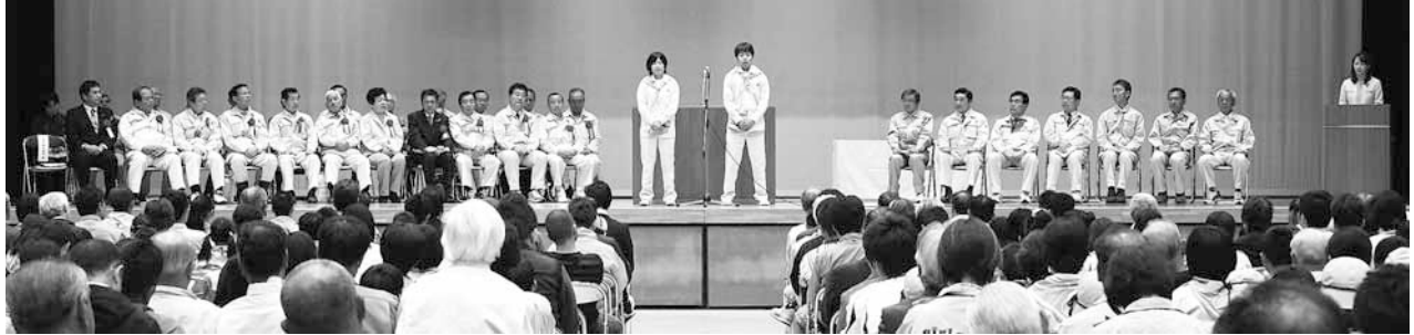
緑の少年隊による「森づくり宣言」