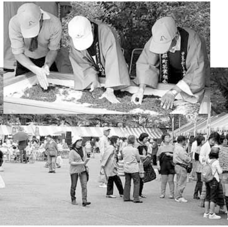
右 職員による新茶手もみ実演 下 会場の様子

会場では新茶とお団子のサービス、ステージでの催し物の他、新茶目方当てクイズ、新茶手もみ実演新茶、新茶つめ放題などが行われ、地元の生産物、竹細工の販売などもあり皆さん楽しんでいました。