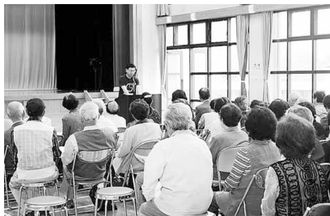
いきいき大学で講演する町長

チャレンジデーとは日常的なスポーツの習慣化に向けたきっかけづくりやスポーツによる住民の健康づくり、地域の活性化を目的とした住民総参加型