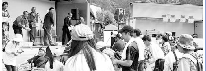
おもち、お菓子投げ

6月2日(日) 町商工会が主催する「うつき姫まつり(うつきさつき姫の里ウォーク2013)」が役場本庁舎前を会場に行われました。