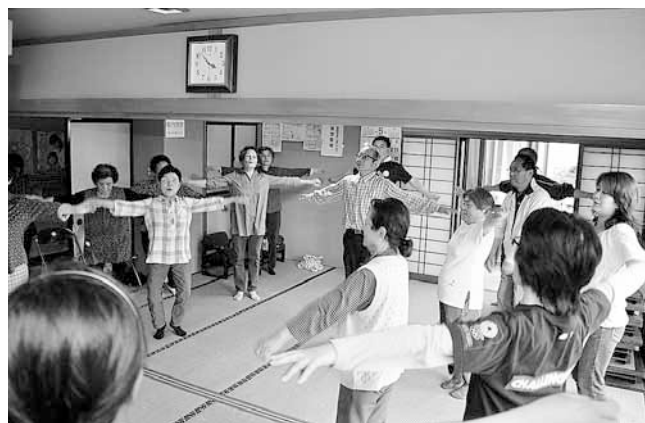
各分館、集会所での健康体操

予想を超え多くの参加をいただく事ができ、このチャレンジデーをきっかけに住民皆様の健康づくりの推進につ