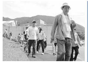
ウォーキング出発！