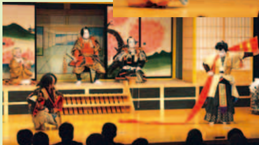
トリは内船歌舞伎が飾りました(左)