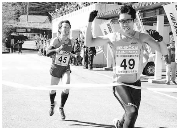
トップ争いはゴールまで接戦でした