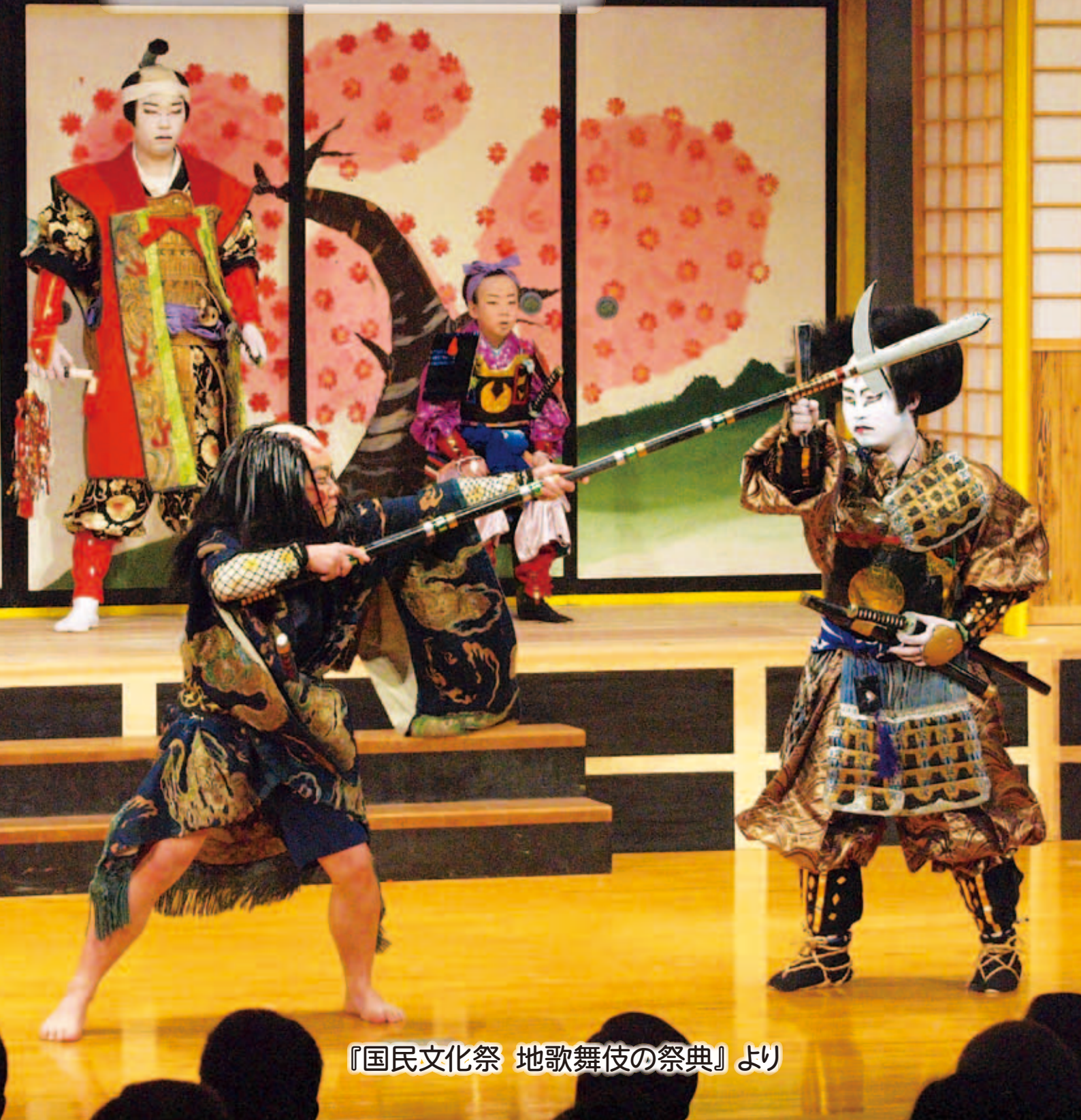
『国民文化祭 地歌舞伎の祭典』より