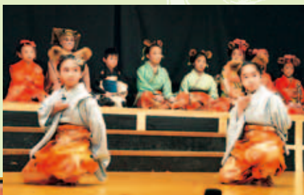
かわいい狸たちの大宴会です(右)