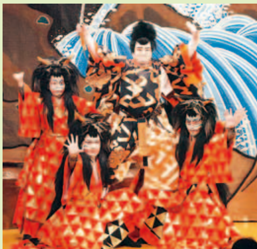
むらくも座の演目の見栄パッチリ決まっています

次に愛媛県松山市から来た久谷地区伊予八百八狸保存会の『創作歌舞伎舞踊 伊予八百八狸(そうさくかぶきぶよういよはっぴやくやだめき)』が演じられました。日本3大狸物語のひとつ、八百八狸物語を歌舞伎舞踊としたものです。