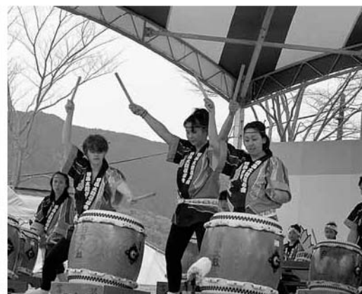
ALTのジャッキーさん・リビーさん