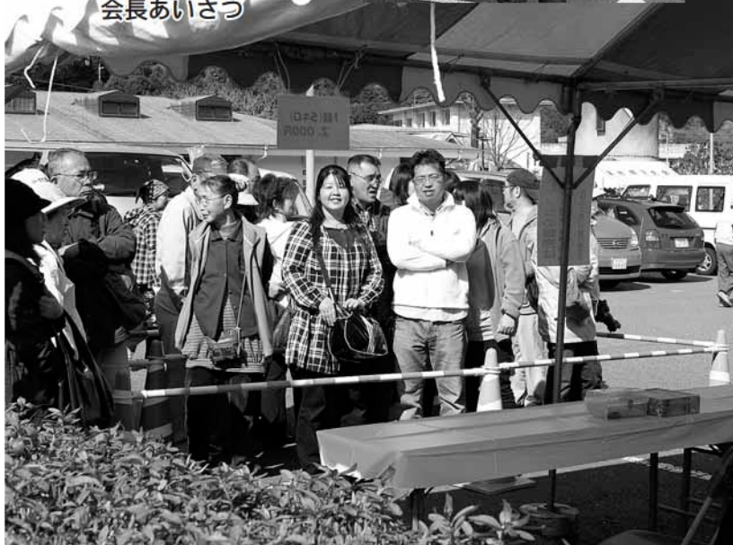
今か今かとたけのこ待ち