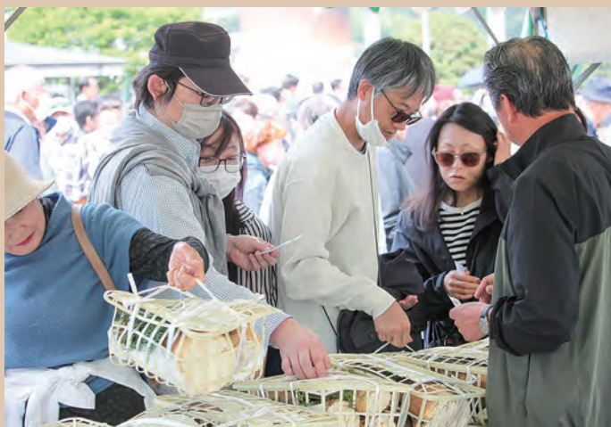
大行列のたけのこ直売!

開催にあたり、多くの皆様のご協力をいただき、大盛況のうちに終了する事が出来ました。ありがとうございました。