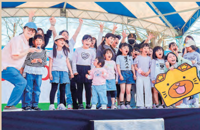
にゃんこスターのお二人と記念撮影!