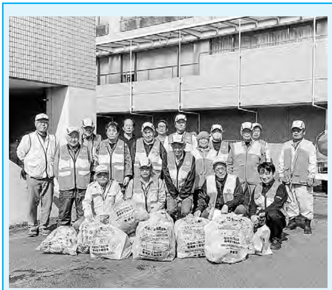
峡南猟友会南部支部富沢分会