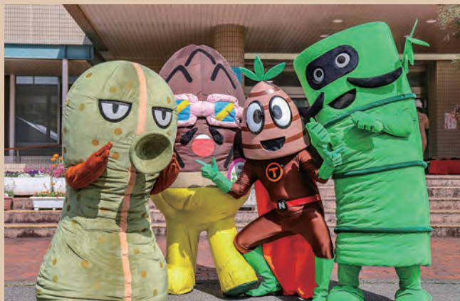
今年もタケノコマンたちが大集合!