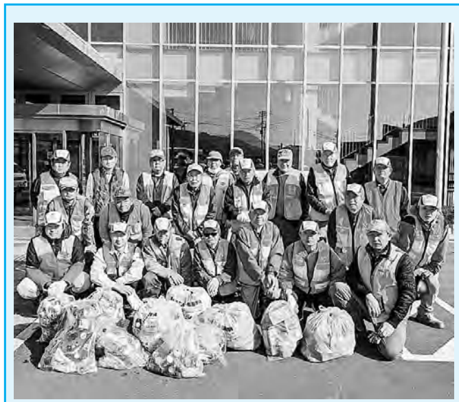
峡南猟友会南部支部南部分会

山林は南部町の豊かな自然の源です。この自然を後世に残していくための一歩として、身の回りのゴミ拾いから初めてみましょう。