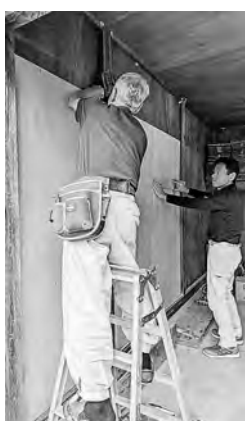
建設組合連合会甲南支部の皆さま、ありがとうございました