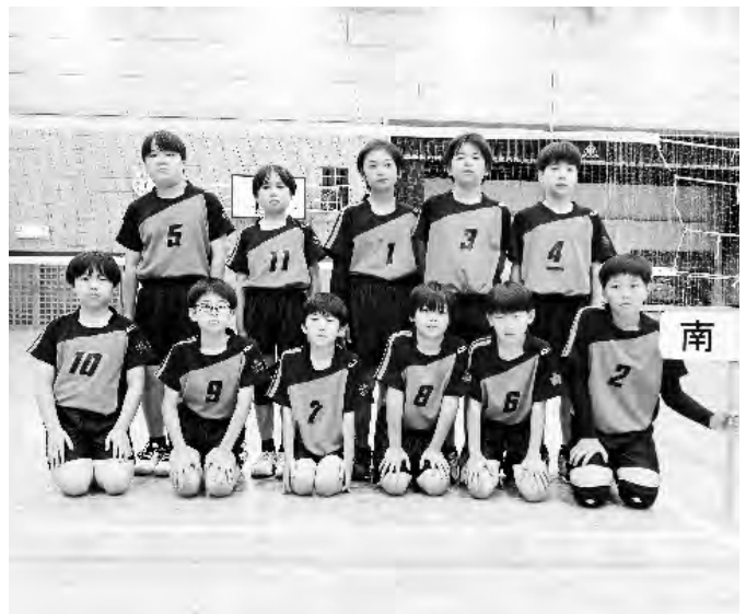
「南部町バレーボールスポーツ少年団」