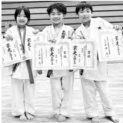
山梨県代表として頑張っています!

また、5月17日(日)に「関東ブロックスポーツ少年団競技別交流大会空手道競技、山梨県予選会」が、小瀬スポーツ公園武道館第一武道場にて開催されました。 こちらの大会にも出場した『太和田道場、空手スポーツ少年団』の、2名の選手が上位入賞し、山梨県代表として7月25日(土)・26日(日)山梨県で開催される「第45回関東ブロックスポーツ少年団競技別交流大会」に出場します。 選手の皆さんのご活躍を応援しています!