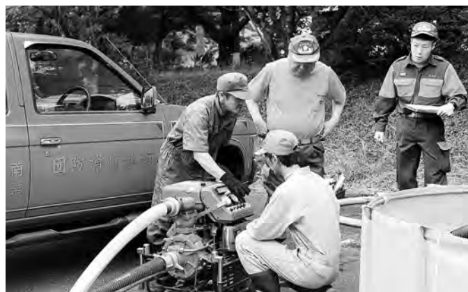
有事の際に備え、きめ細やかなメンテナンスを行いました（ポンプ性能試験）