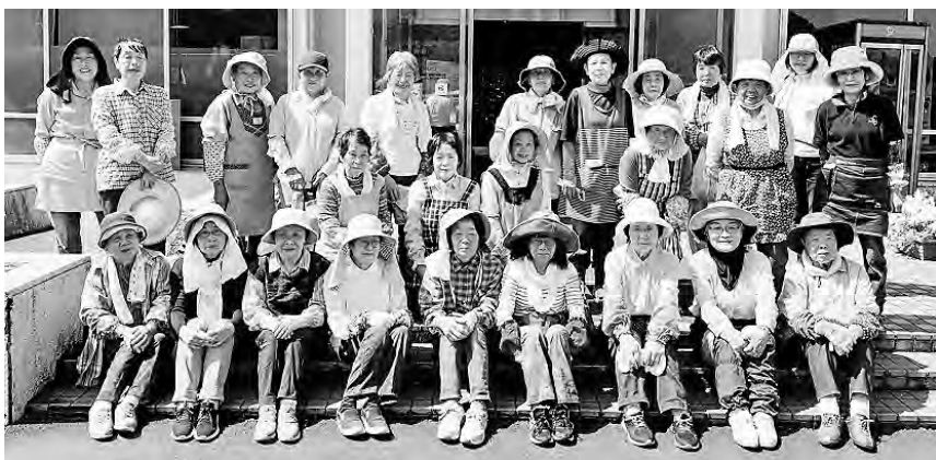
南部地区ボランティアの会の皆さま

南部地区ボランティアの会の皆さまには、毎年この時期にアルカディア南部総合公園の草取りをしていただいております。