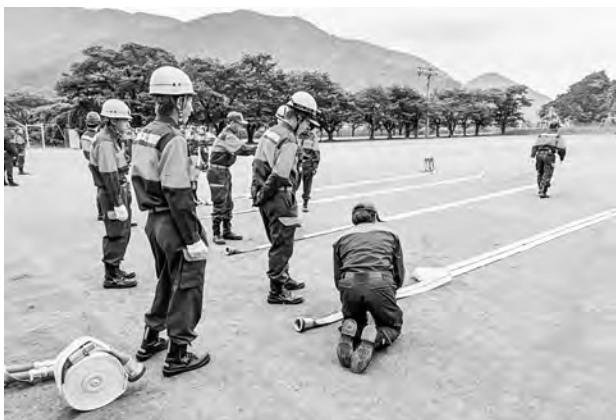
ホース取り扱い方の指導（移動消防学校）

また、アルカディア野球場駐車場で同時に行われたポンプの性能試験では、専門の業者により、消防ポンプ車や小型ポンプの機械点検を行い、有事の際に速やかな消防活動が出来るように備えました。