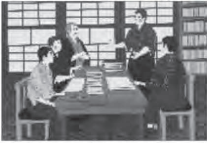
蒙軒学舎での授業風景(イメージ)

近藤喜則は、若い頃から親戚でもあった、伊豆の江川太郎左衛門英龍の家老柏木家に入りし、英龍の考えに感銘する中で子弟教育（「修身立志」）に強い関心を持つようになりました。明治新政府の世になると、喜則は人材育成の重要性を悟り、すぐに動き出します。明治2年（1869）、地元の子どものための教育の場として妙浄寺の一室を借り