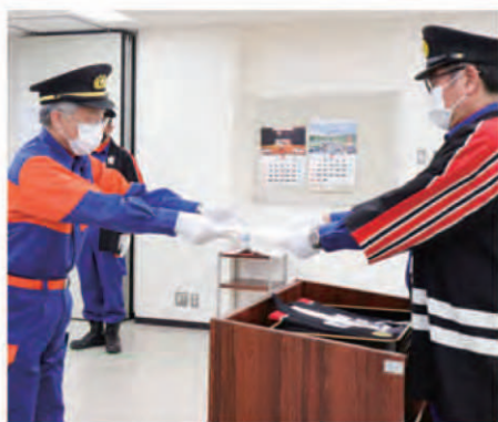
新団長へ任命状が 交付されます