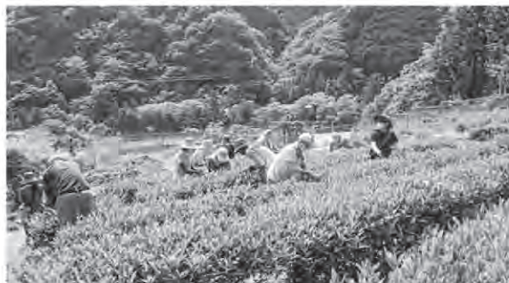
茶摘み体験の様子