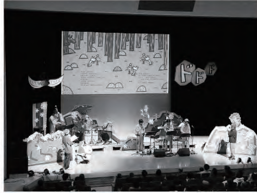
絵本と音楽のコラボレーション