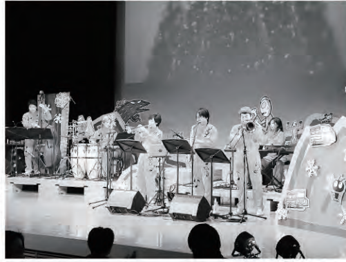
ミラクル音楽隊の皆さん