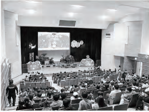
多くの方が来場されました