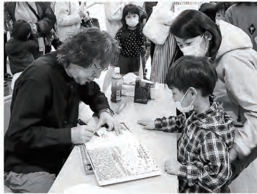
サイン会也大盛況となりました