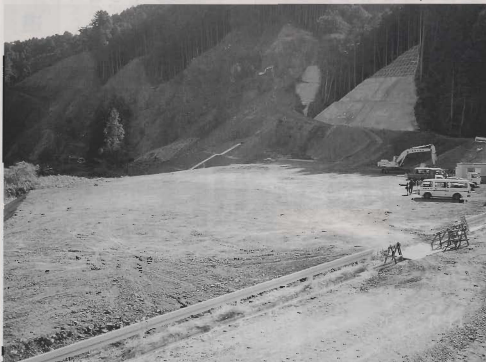
火葬場建設予定地 (大和地内)