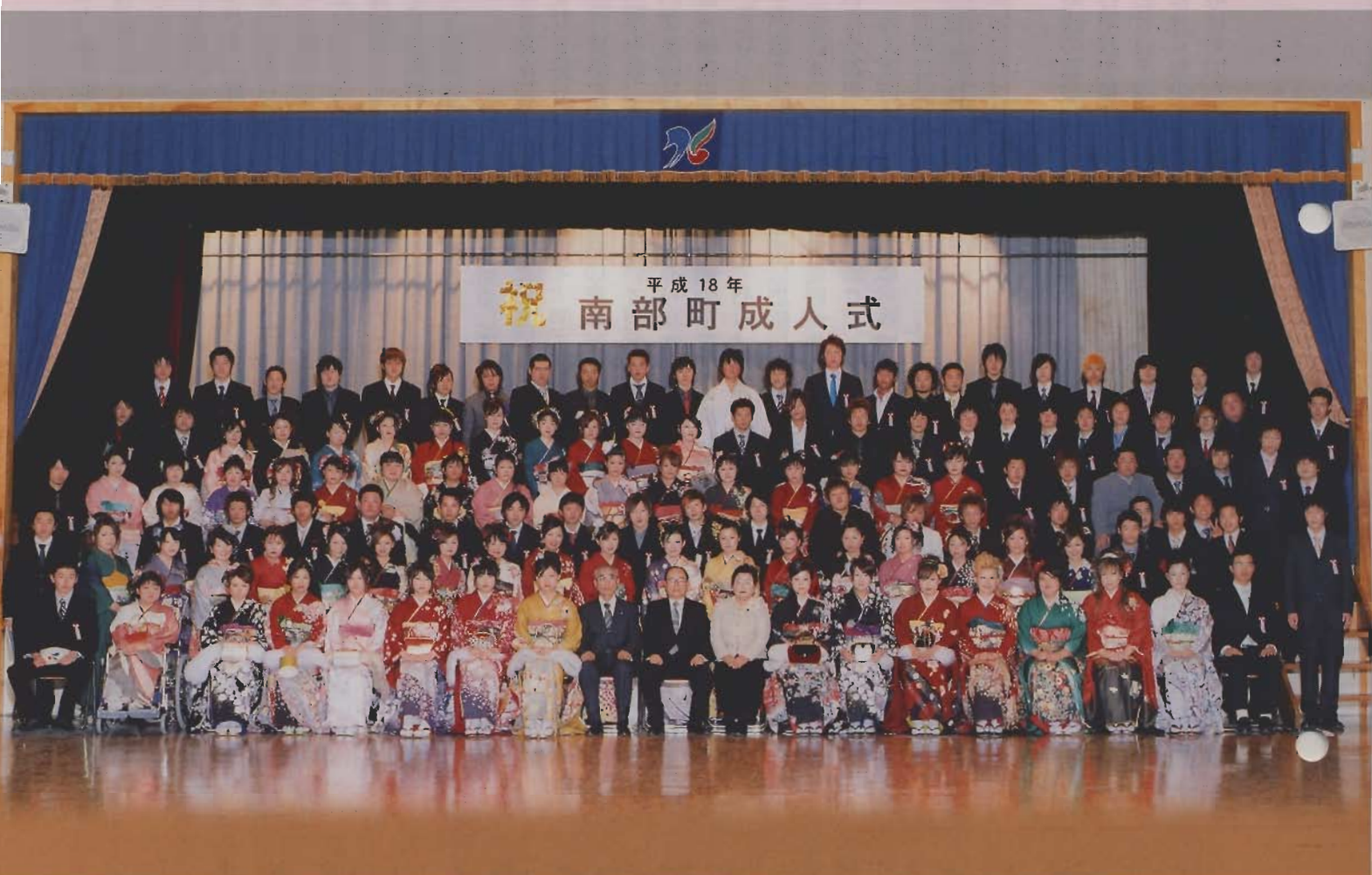
平成18年南部町成人式

南部町ホームページ http://www.town.nanbu.yamanashi.jp/