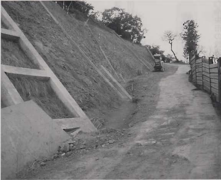
内船中区中尾 (急傾斜地)

行の試掘は、質・量とも問題があり、既設の横沢水源の近くが、良いので、需要に答えるため、ここをお願いしたい。