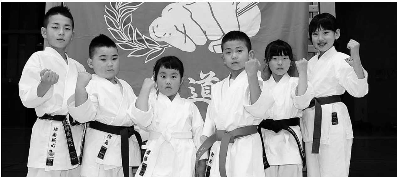
関東大会・全国大会へ行っても頑張るぞ!

また2位までの5名は山梨県代表として、8月4日(土)、5日(日)に東京都で開催される「第18回全日本少年少女空手道選手権大会」に出場します。