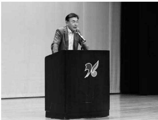
講話にも熱が入ります