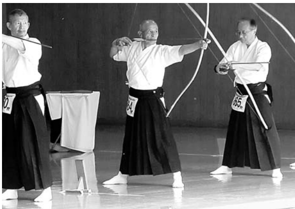
世界を相手にいざ決勝へ