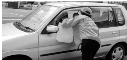
出発式、啓発活動を実施しました