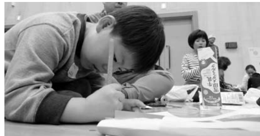
親子で楽しく工作しました