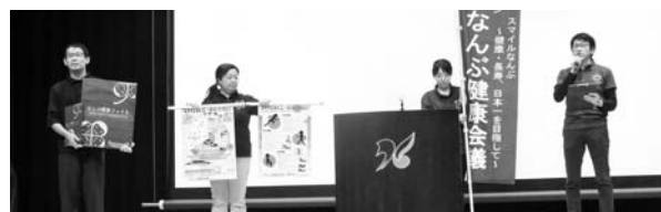
早期発見をテーマに行われました