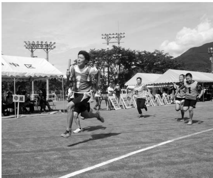
晴天に恵まれ体を動かしました