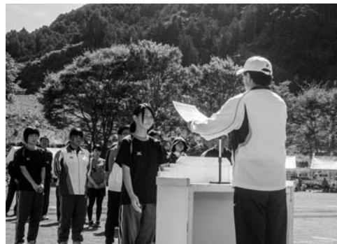
受賞された皆さんおめでとうございます