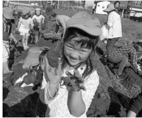
大きいおいもや小さいおいもがたくさんとれました