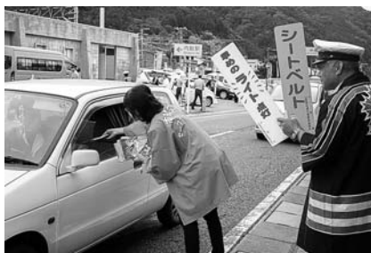
内船駅前での啓発活動