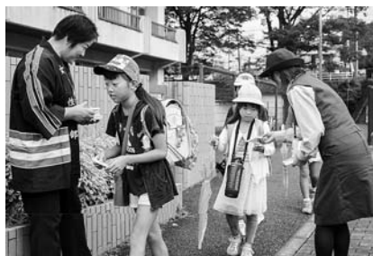
交通安全を呼びかけました