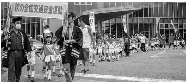
内船駅までパレードしました

また、この取り組みの一環として9月30日(金)に睦合・栄保育所園児による交通安全パレードが実施され、交通事故防止を呼び掛けました。