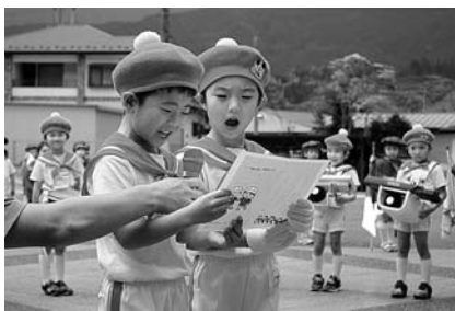
「交通安全のおやくそく」をしました