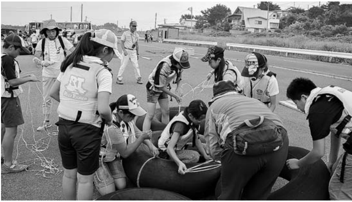
みんなでいかだを作りました