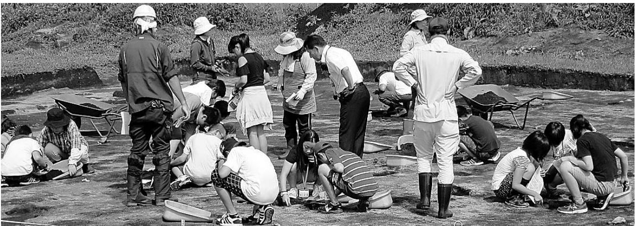
南部氏史跡「 しょうじゆ じ たてあと 聖寿寺館跡」発掘体験