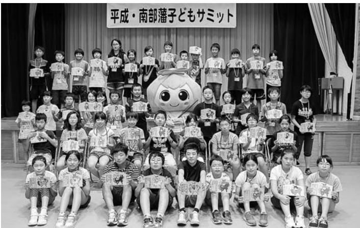
参加者全員で記念写真

青森県からは南部町、八戸市、七戸町、三戸町、岩手県からは二戸市、盛岡市、遠野市、山梨県からは南部町、身延町の小学生44名が参加しました。