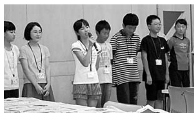
青森・岩手の児童と交流し、南部氏について学びました