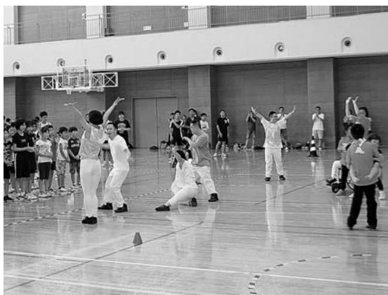
kie&Vividboys のダンスパフォーマンス