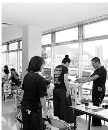
健康測定コーナー

また、『健康測定コーナー』&『1日まちの保健室』を開設し、来場された皆様の健康状態を測定し、峡南地区フェスタ看護実行委員からアドバイスをしていただきました。会場の外では町職員青年部による軽食販売も大好評でした。ご協力いただいた皆さんありがとうございました。