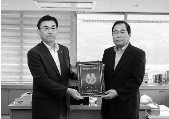
佐野町長と中部セグメント(株)深田社長