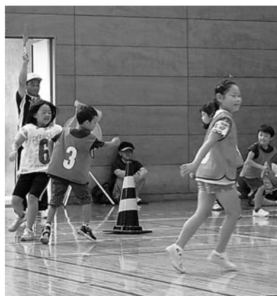
スポーツ鬼ごっこ 白熱しました

7月24日(日)アルカディアスポーツセンターでアルカディアスポーツフェスタ2016が教育委員会、スポーツ推進委員会の共催で開催されました。体育館では子どもクラブ連合育成会等が参加して「スポーツ鬼ごっこ大会」が行われ、小学生チーム、中学生チームが出場し、元気いっぱい走り回っていました。その後は、ダウン症の障害を持つ5人のメンバー、『kie&Vividboys』の皆さんによるダンスパフォーマンスが行われました。