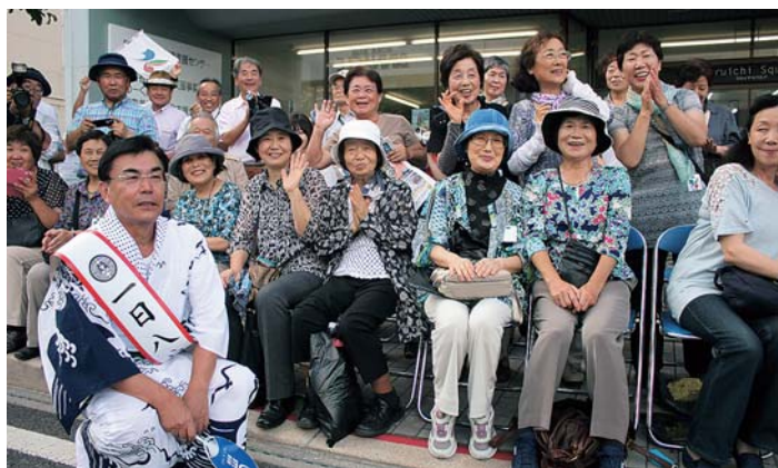
南部町からもツアーで訪れました

南部町は、南部氏発祥の地とされています。歴史の継承、観光施設として資料等を収集し、新たに整備される「道の駅」で南部氏関係の資料館を計画しています。