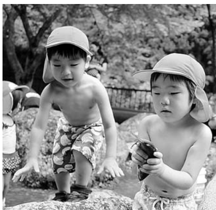
上手につかまえました！

7月21日(木)、22日(金) 山水徳間の里で、町内保育所園児がマスのつかみどりを行いました。子供たちは楽しそうに魚を追いかけていました。上手につかまえる子もいれば、魚を怖がる子もいましたが、園児の表情はとも楽しそうでした。園児がつかまえた魚は職員・保護者がさばいて各家庭に持って帰りました。おいしく食べてください。