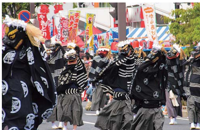
大人から子どもまで多くの方が参加しました