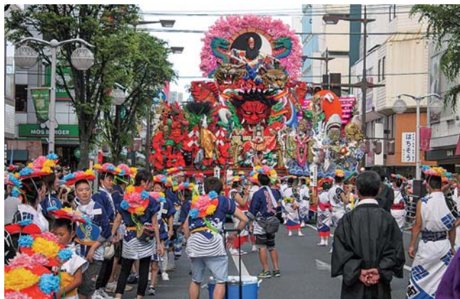
華麗な山車が練り歩きました