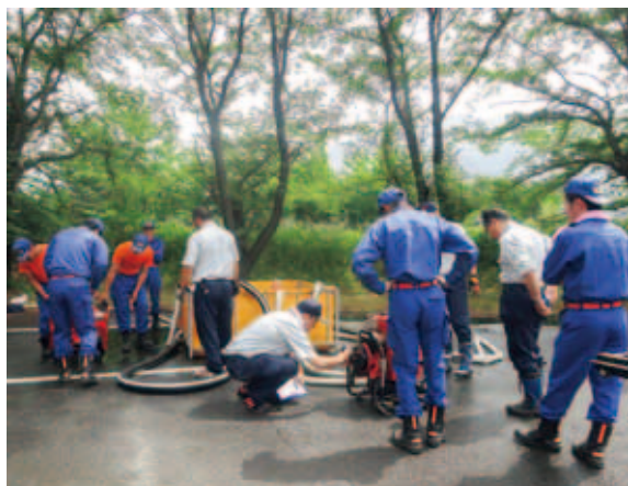
専門業者により機械点検を行いました