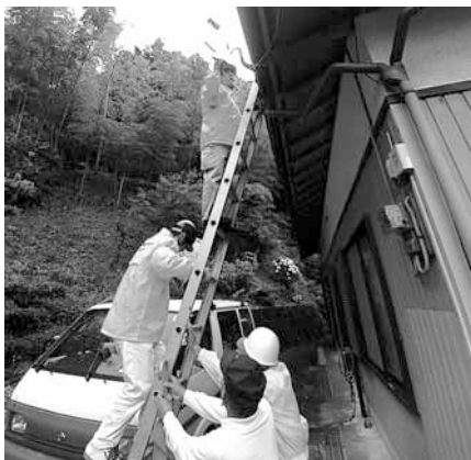
毎年ありがとうございます