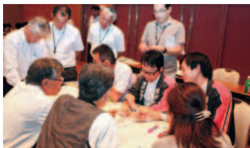
マップ作りの様子