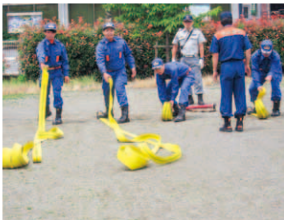
新入団員が基礎教育を学びました

を専門の業者により入念な点検が行われ、各部より多くの団員が参加し、維持・管理について指導をしていただき、有事の際に速やかな消防活動が出来るように機械点検を行いました。