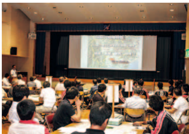
「防災の心構え」をテーマにした講義の様子

災害や風水害の警戒区域への色分け、避難場所、病院の位置、応急手当てができる人がどこに住んでいるのか、災害時要支援者の自宅位置の把握、消火栓、防火水槽の設置場所などを地図上に示し、自分の住んでいる地域の特性や地域の防災資源(物的資源・人的資源)を再確認するとともに、災害イメージを抱き、その重要性を検証していただきました。