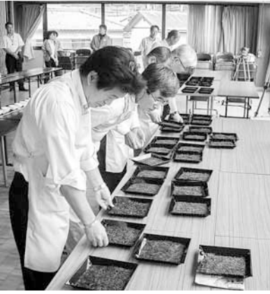
良いお茶ばかりでした