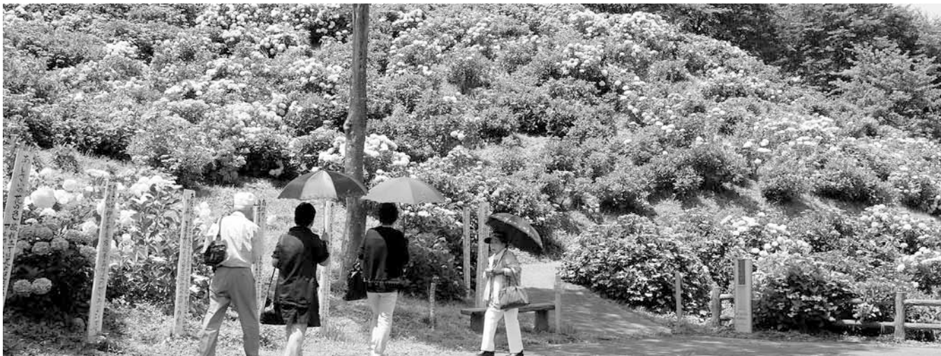
今年もきれいに咲きました