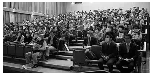
多くの方が真剣に聞き入っていました