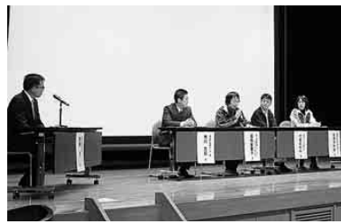
パネルディスカッション