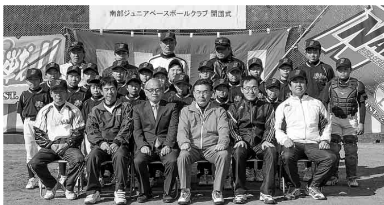
新生! 南部ジュニアベースボールクラブ

新団がさらに発展し、団員の皆さんがより高いレベルへ挑戦し続けていってほしいと思います。頑張ってください。