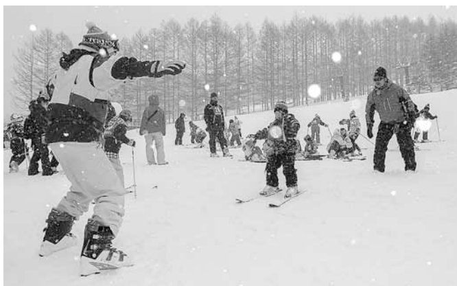
上手に滑りました