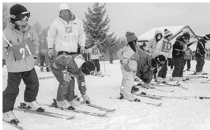
うまく履けたかな