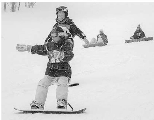
初めてのスノーボード