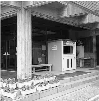
分庁舎の回収ボックス

これらの家庭から出た、まだ使える衣類等は主に中古衣類として海外で使用され、次の利用者の方の役に立っているとともに資源の節約と処理費用の削減につながっています。今後も皆様のご協力をお願いします。