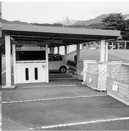
本庁舎の回収ボックス