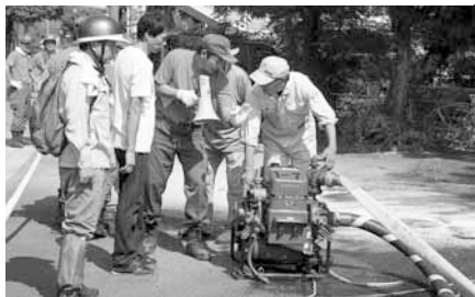
可搬ポンプ操作訓練