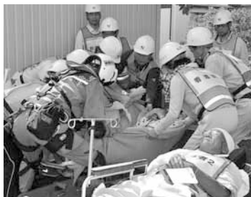
重症者の搬送訓練

合同訓練において南部区では、医療センター駐車場に負傷者を受け入れる救護所を町が開設し、負傷者重症度判定救護訓練（トリアージ訓練）と重症患者を富士宮市内の病院へ防災ヘリで搬送する訓練、文京区では、負傷者を区民の協力で応急手当と担架による搬送を行い、同市の病院へ自衛隊ヘリで救出する搬送訓練が行われました。