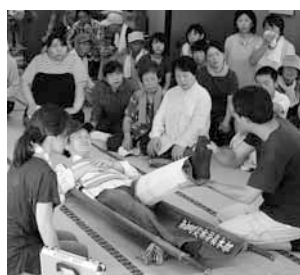
負傷者の応急手当訓練