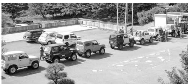
緊急物資搬送訓練

また、町災害対策本部では、富士宮市から緊急支援助物資の搬送要請を受け、後方支援体制を図り、職員及びNPO法人山梨県地震対策四駆隊20台により、同市への物資搬送訓練も行われました。 今後実践的訓練を積み重ねて実施することにより、地域防災力を向上し、自助・共助・公助の一層の理解と連携を深め、一人ひとりの意識高揚と、災害応急対策が速やかに行えるよう防災・減災体制の重要性について認識を新たにしました。