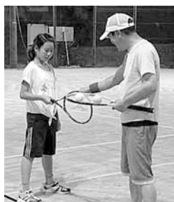
ラケットの持ち方