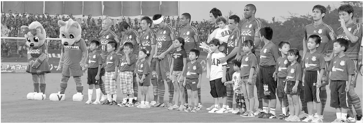
選手と入場しました