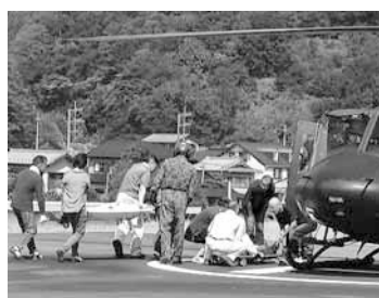
自衛隊ヘリによる搬送訓練

また、町災害対策本部では、富士宮市から緊急支援助物資の搬送要請を受け、後方支援体制を図り、職員及びNPO法人山梨県地震対策四駆隊20台により、同市への物資搬送訓練も行われました。 今後実践的訓練を積み重ねて実施することにより、地域防災力を向上し、自助・共助・公助の一層の理解と連携を深め、一人ひとりの意識高揚と、災害応急対策が速やかに行えるよう防災・減災体制の重要性について認識を新たにしました。