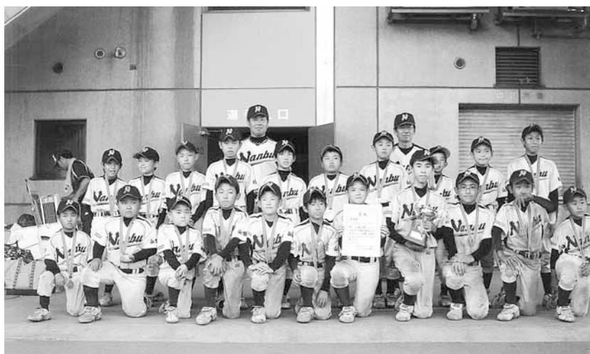
南部スポーツ少年団