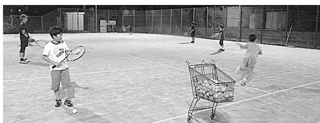
テニス教室の様子