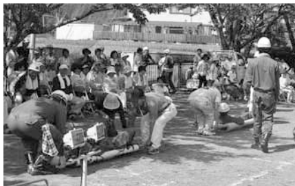
簡易担架作成・搬送訓練