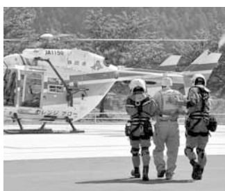
防災ヘリによる搬送訓練