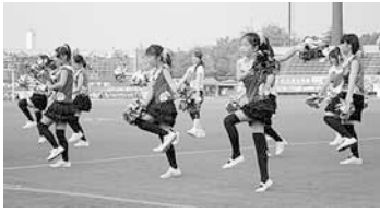
グリーンマーチングによるパフォーマンス