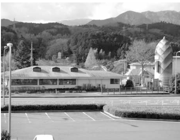
南部町第1号の指定管理 「道の駅・とみざわ」

指定期間は、平成21年4月1日から平成26年3月31日までの5年間です。今後の施設管理・運営は南部町商工会(指定管理者)が行うこととなりますが、町も設置者として南部町商工会とともに一層の町民サービスの維持・向上を図るよう努力して行きます。よろしくお願いたします。