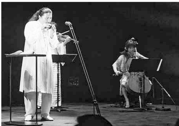
すばらしい表現力

これは地域文化の振興を目的に、宝くじ文化講演として「心の中の原風景」と題し行われたもの。演奏では、大小様々な7種類ほどのオカリナを、自由自在に使いこなし、異次元の優しい音色で会場を包み込みました。また、満員のお客さんは、その音色に照明の特殊効果が加わって「うっとり」。なかなか聞くことの出来ない素晴らしい演奏に、とても満足なコンサートになりました。