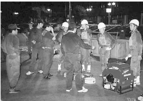
夜間、小雨降る中の練習