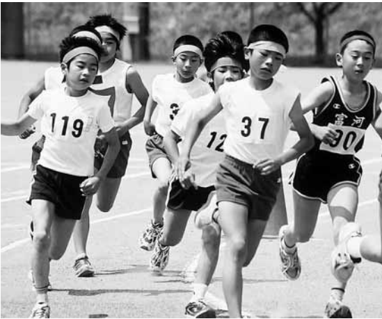
おれ がんばれるぞー

競技は、100m走・800m走・高跳び・ボール投げ等8種目で、参加した児童は「1秒でも1センチでもいい記録を」と、必死な表情で取り組み、自己新記録が出るとガッツポーズをして喜んでいました。また、最後に行われたリレーでは、走る選手の背中を後押しするように大きな声援がグラウンドいっぱいに響いていました。日頃の成果を発揮した満足のいく記録会となりました。