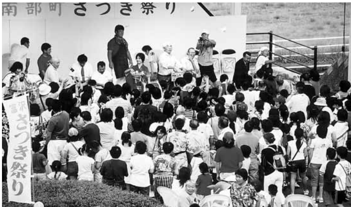
もちかー おかしかー

当日は、映画の上映、歌謡ショー、太鼓等の演奏が行われ、子供から大人まで夕涼みをしながら祭りを楽しみ、模擬店やフリーマーケット等がさらに花を添え、訪れた人のお腹までも満足させるお祭りとなりました。特に、餅投げや、大抽選会ではステージ前に人が押し寄せ、大賑わいとなりました。