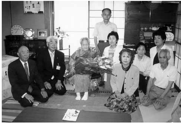
さあさっ おひとつ