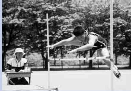
ホラッ ちょっと余裕