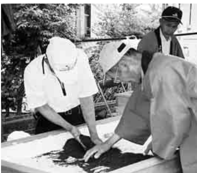
そーそう やさしくね