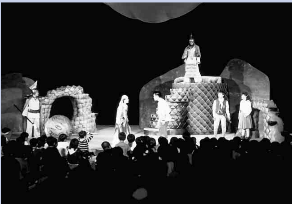
身をのり出す子供たち

荒らされ続けている海(海底)に探しに行くお話です。戦争のみにくさ、人間の手による自然破壊等により「これからの世界はどうなっていくのか」と疑問を投げかける作品で、子供達自身の意思と勇氣、仲間を信じて助け合いながら立ち向かっていく精神が描かれていました。 鑑賞した子供達は、色鮮やかなステージ・衣装、役者の迫真の演技に圧倒され、背筋を伸ばして、目を丸くした真剣な表情が、印象的でした。