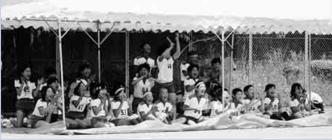
笑わせるな がんばれー

晴天のこの日、児童は自己の記録更新を目指して各競技に参加しました。各競技ともスタート前の緊張感、ゴール後の安ど感が伝わってくる見応えのある記録会で、声援に後押しされ、日頃の練習の成果を発揮できた子供達が、少し大きく成長して見える有意義なものでした。