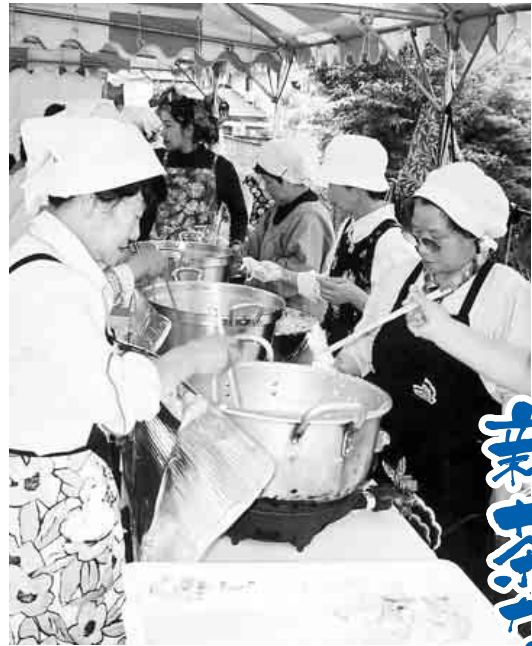
こっちみないで つまみ食い