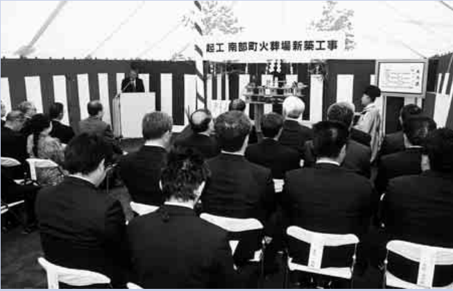
安全に完成を祈る

新火葬場完成は、平成18年中を予定して工事期間中、アルカディア周辺に関係車輛等が多く出入りするため、ご迷惑をおかけしますが、皆様のご理解ご協力をお願いいたします。