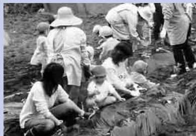
みんながんばってます

富河保育所横の畑では、400本程のさつま芋のつるを丁寧にさしていきましました。秋には、食べきれないぐらいい収穫出来るかなあ！