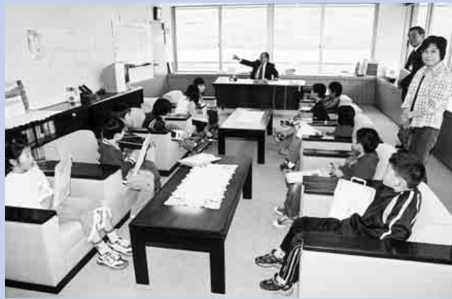
町長さんは今、何時間目ですか？