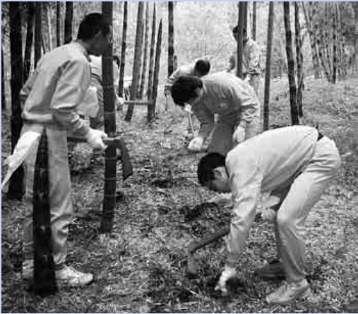
鍬じゃ うまくいかねえーな

これは産業振興課の主催で行われている事業で、今年は天候の関係で万沢中学校のみが体験した、少し寂しい学習となりました。しかし筍は、当たり年にふさわしく豊富で、参加した生徒は掘り方の指導を受けると、一斉に思い思いの場所へ散らばって行きました。夢中で鍬を振り、筍を掘り出した時の満足気な表情が印象的な体験学習でした。