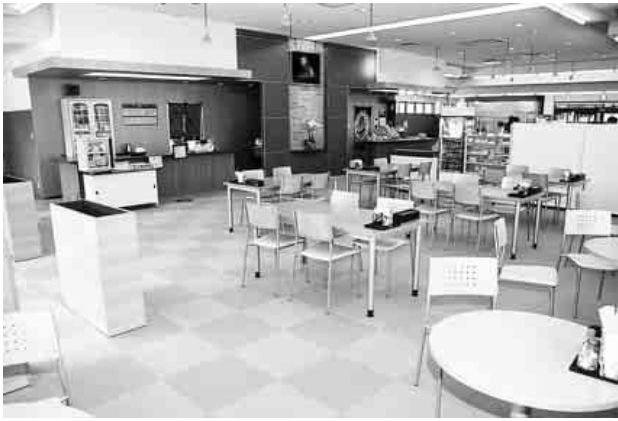
明るくなった店内

今回の改修では、外観に大きな変更は見られないものの、内装は一転、食堂からショップまで近代的で明るく開放的に仕上がりました。特に食堂は、座席数が倍以上となり町内外・遠方からのお客様の食事処・休息の場として、また「憩いの場」として、町のシンボルの施設がより清潔感あふれるものに生まれ変わりました。