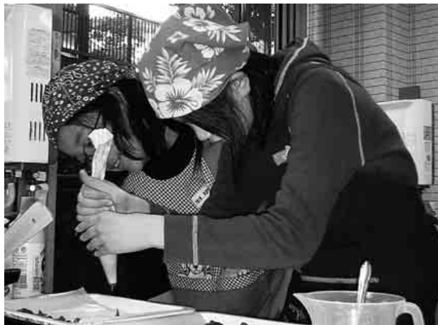
ニョロニョロっとな

1月27日・2月3日 小学生お菓子作り教室が活性化センター・総合会館それぞれの会場で行われました。