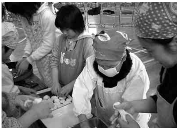
黙々と働くおばあちゃん