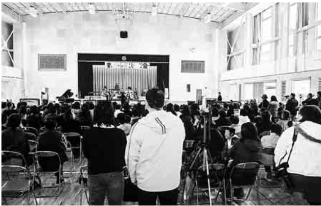
デカイくちで唱ってる

当日は、昨年12月に完成したばかりの広々と明るい体育館で、児童がこの日のために練習してきた合唱・合奏を披露しました。体育館に集まった大勢の保護者も、児童達の元気いっばいのかわいい歌声、美しいハーモニーに合わせてリズムを取りながら聞き入っていました。また、発表が終わるたびにビデオ・カメラの撮影の手を止めて、大きな拍手を送っていました。