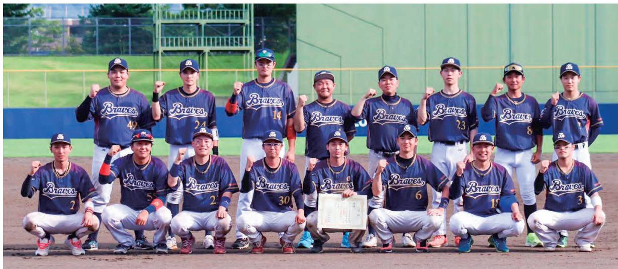
優勝おめでとうございます!