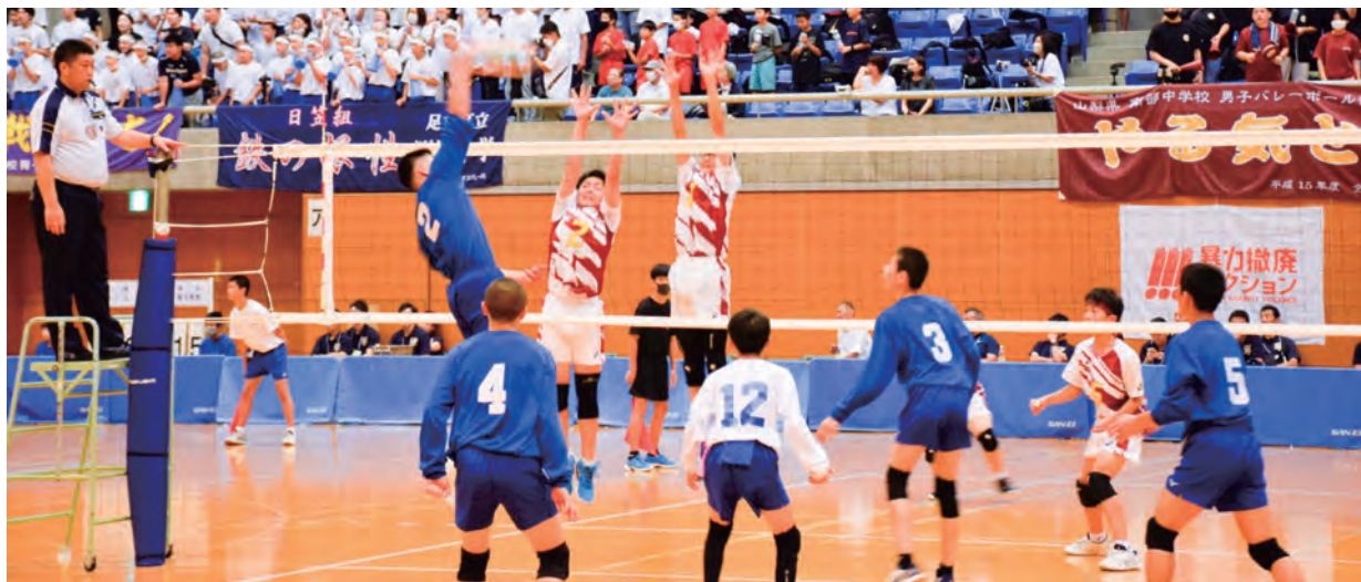
チーム全員で勝利をつかみ取りました