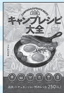
キャンプレシピ大全決定版 ソトレシピ 編 新星出版社