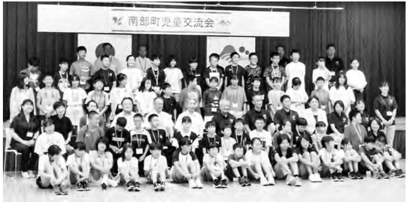
歓迎セレモニーの様子