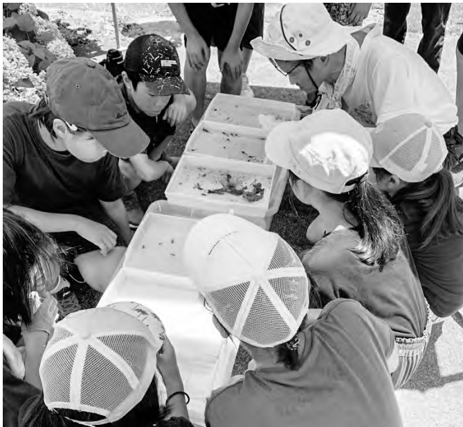
真剣な表情で説明を聞きます

生き物調査を通して田んぼの中の生き物と触れあい、田んぼの色々な働きやお米作りと生き物の関わりについて、体験しながら学ぶことが出来ました。