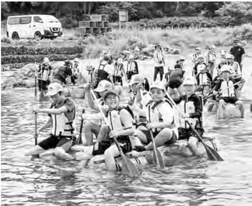
いかだ乗り体験中