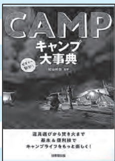
キャンプ大事典 松山 拓也 監修 成美堂出版