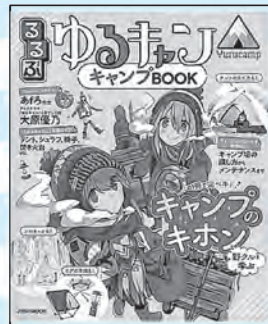
ゆるキャン△ キャンプBOOK JTBパブリッシング