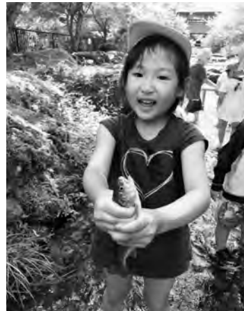
笑顔いっぱい、魚もいっぱい取れました