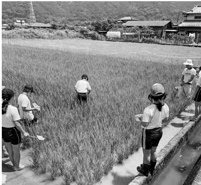
どんな生き物がいるかな？