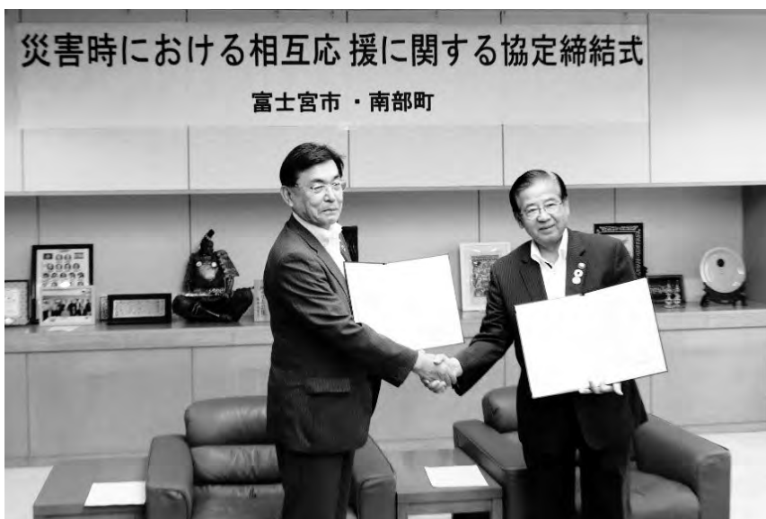
固く握手する佐野町長(左)と須藤秀忠市長(右)

7月13日(木)、静岡県富士宮市と「災害時における相互応援に関する協定」を締結しました。日頃から生活圏を共にする富士宮市と、災害時に県を超えた相互応援を円滑に行うため、今回の協定を締結する運びとなりました。