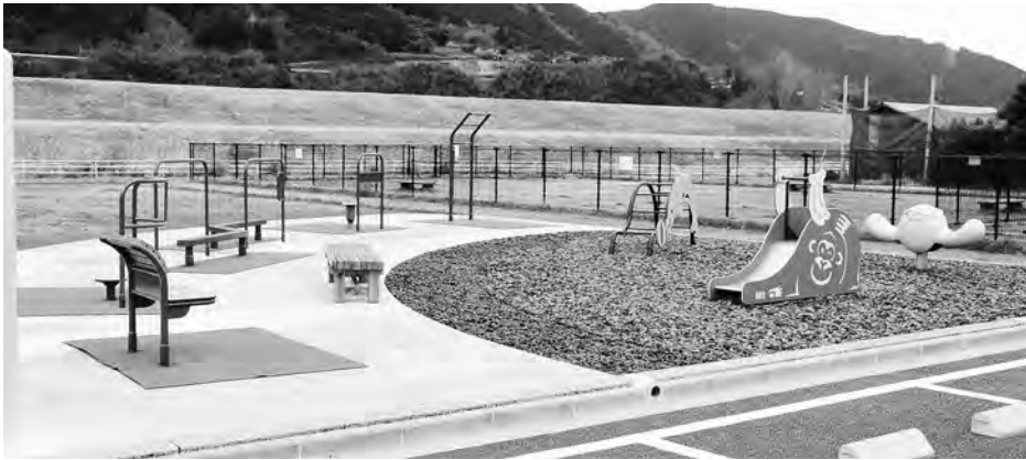
健康器具と遊具が揃って利用しやすくなりました