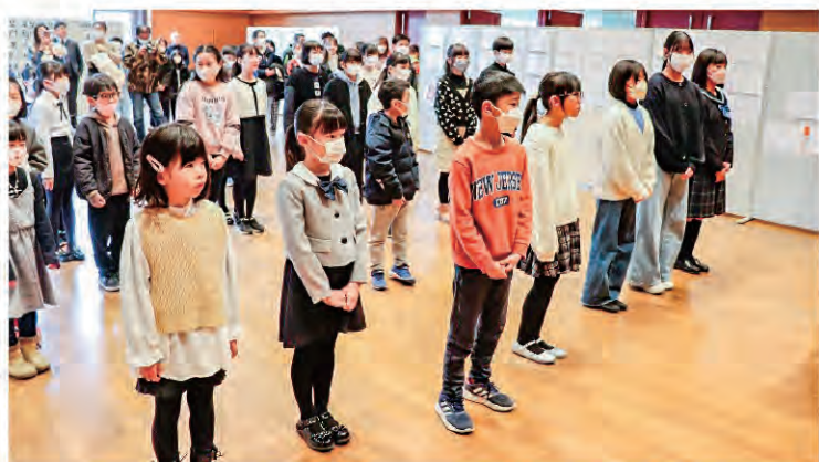
金賞を受賞された皆さん、おめでとうございます