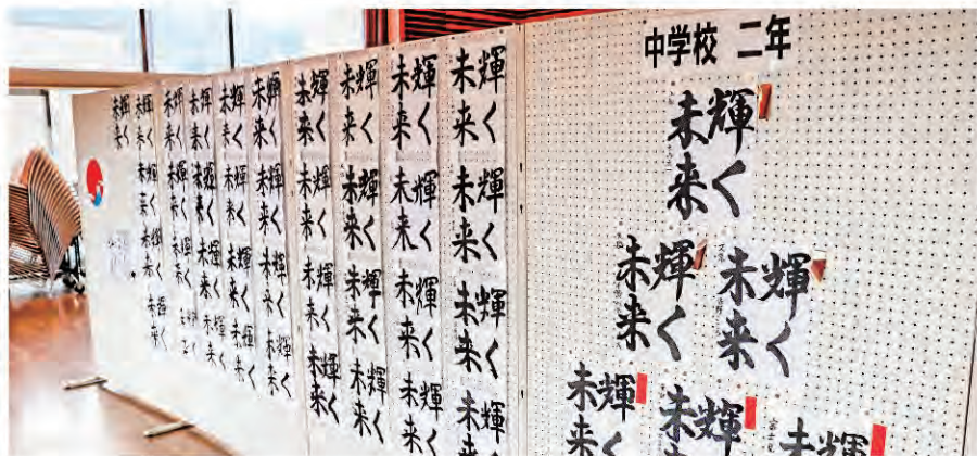
渾身の作品が並びました

令和6年1月26日から28日にかけて、農村環境改善センターで子どもクラブ、連合育成会新春書道展が開催され、児童・生徒たちが冬休み中に取り組んだ力強い作品315点が展示されました。1月28日(日)には同会場場で表彰式が行われました。