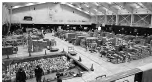
珠洲市立健民体育館