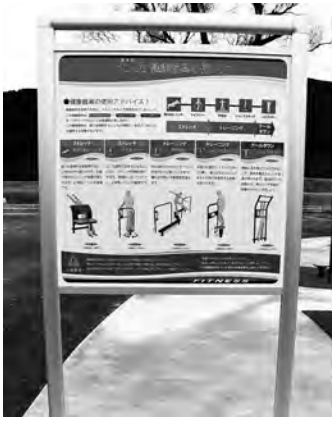
健康器具の使い方