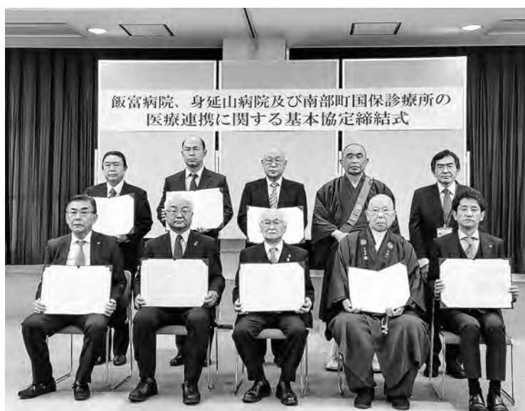
峡南南部の医療を守ります

峡南南部地域では、人口減少の深刻化や医療人材不足で、このままでは医療提供体制の維持が困難になるとの懸念がありました。この3医療機関が連携することにより、独立性を保ちつつ役割分担をしながら、経営基盤の安定を図り、峡南南部の地域医療の維持を目指すこととなります。