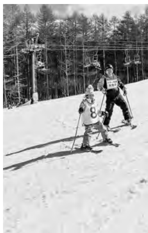
スイスイ滑れるようになりまし

当日は天候にも恵まれ、参加した皆さんは、元氣いっぱいにはスキー・スノーボード・雪遊びと冬のスポーツを楽しんでいました。