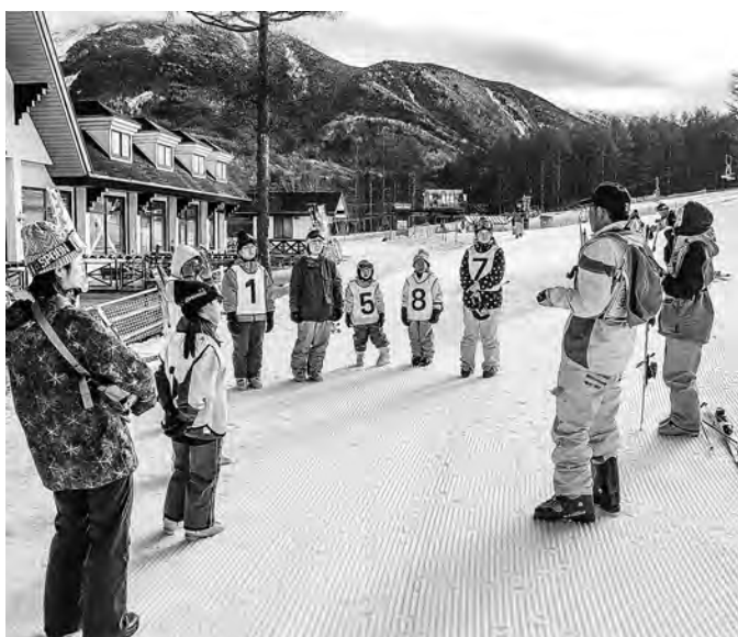
滑る前に講師の説明を聞きます