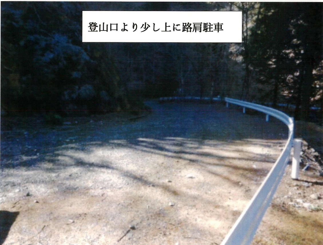
登山口より少し上に路肩駐車