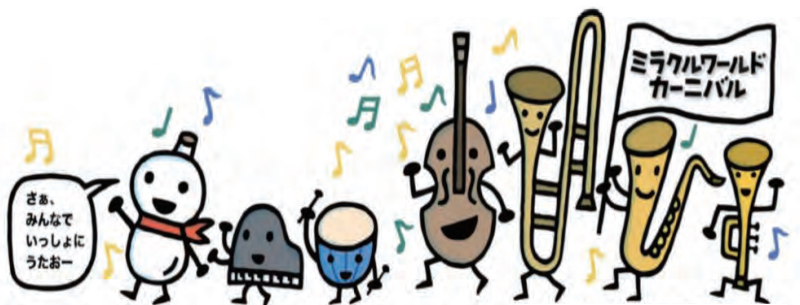
© 宮西達也 © DreamQuest Sound Inc.