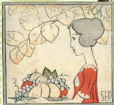
・婦人グラフ9月号表紙・秋