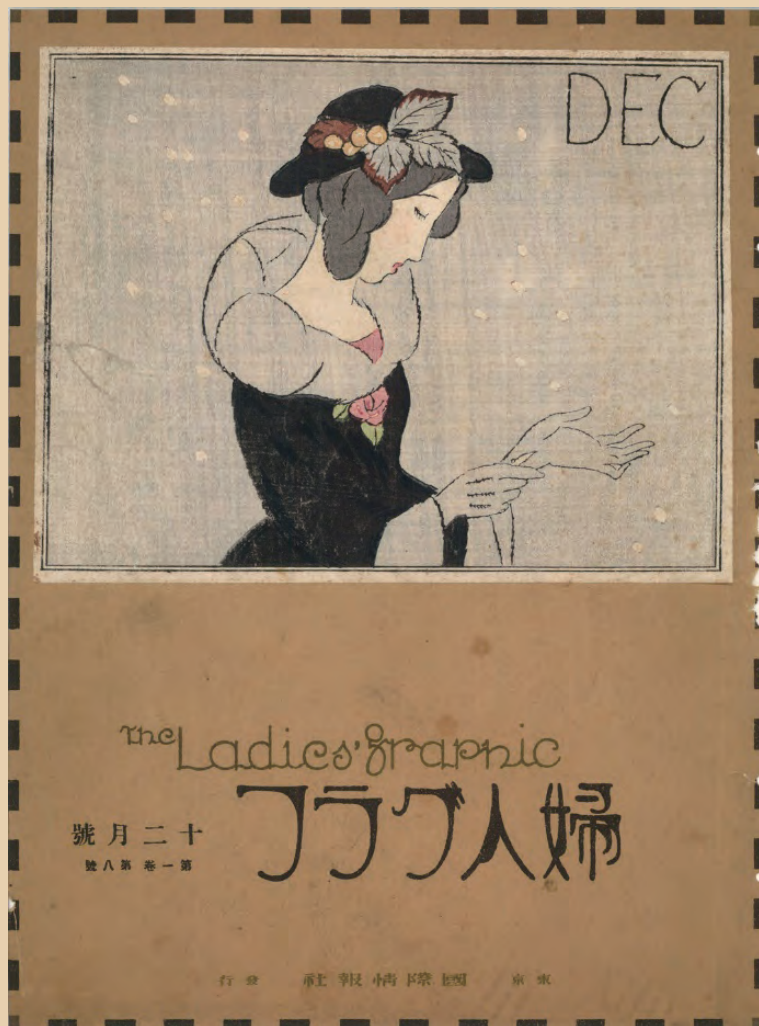
「婦人グラフ12月号表紙・雪の風」

〒409-2213 近藤浩一路記念南部町立美術館 山梨県南巨摩郡南部町大和360番地 ☎0556-62-9292